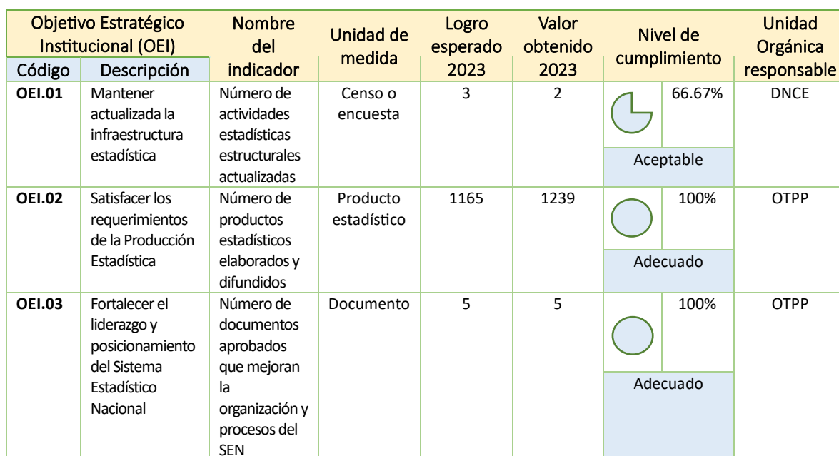
Cuadro N° 3: Valoración del logro alcanzado por OEI

Fuente: Anexo B-7 Seguimiento del Plan Estratégico Institucional (PEI), año 2023.