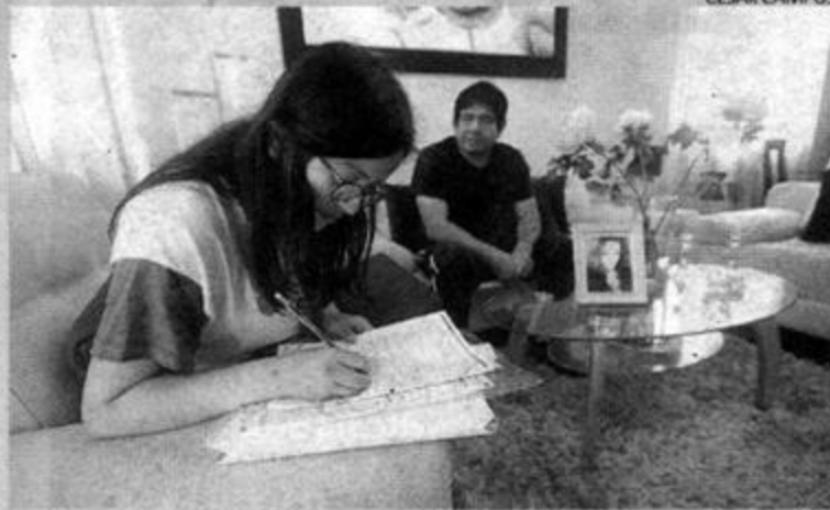
■ RECLAMOS. No llegaron a todas las viviendas del país.

los inconvenientes que se registraron durante el censo, solo basta con preguntarle a un amigo, prender la televisión, revisar las redes sociales