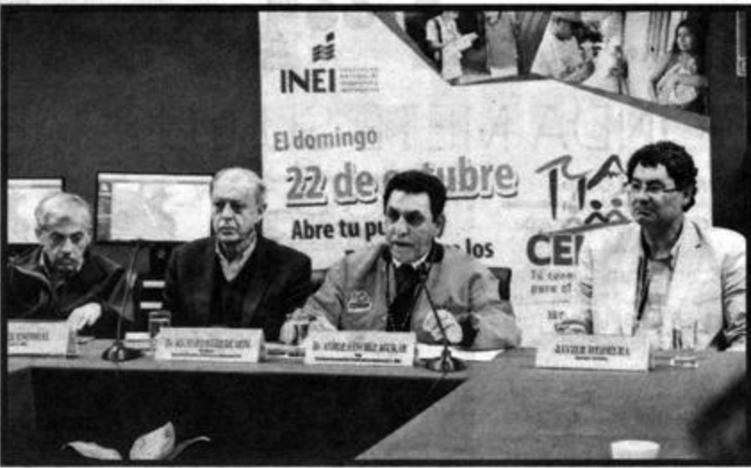
Organizadores del censo prometen que se cumplirá con lo programado.

presa privada ha apoyado la realización de los censos. Recordó que en ediciones anteriores, entidades bancarias apoyaron con publicidad, como ahora universidades, empresas y bancos. Sobre las agresiones sufridas por algunos empadronadores, Sánchez dijo que aún no tiene la información completa, pero "sabe" que estas personas fueron atendidas oportunamente. En el censo se georreferenciaron 1,874 distritos, 10,105 zonas y subzonas, 474,377 manzanas, 9'945,680 viviendas, 95,533 centros poblados, 2,968 comunidades nativas y 6,239 comunidades campesinas, según el INEI. Se busca cumplir con todos.