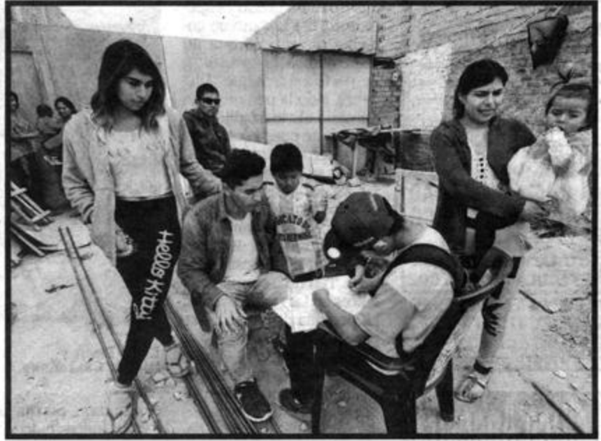
El pueblo peruano colabora y quiere ser censado.

Empadronadores siguen llegando a lugares lejanos.