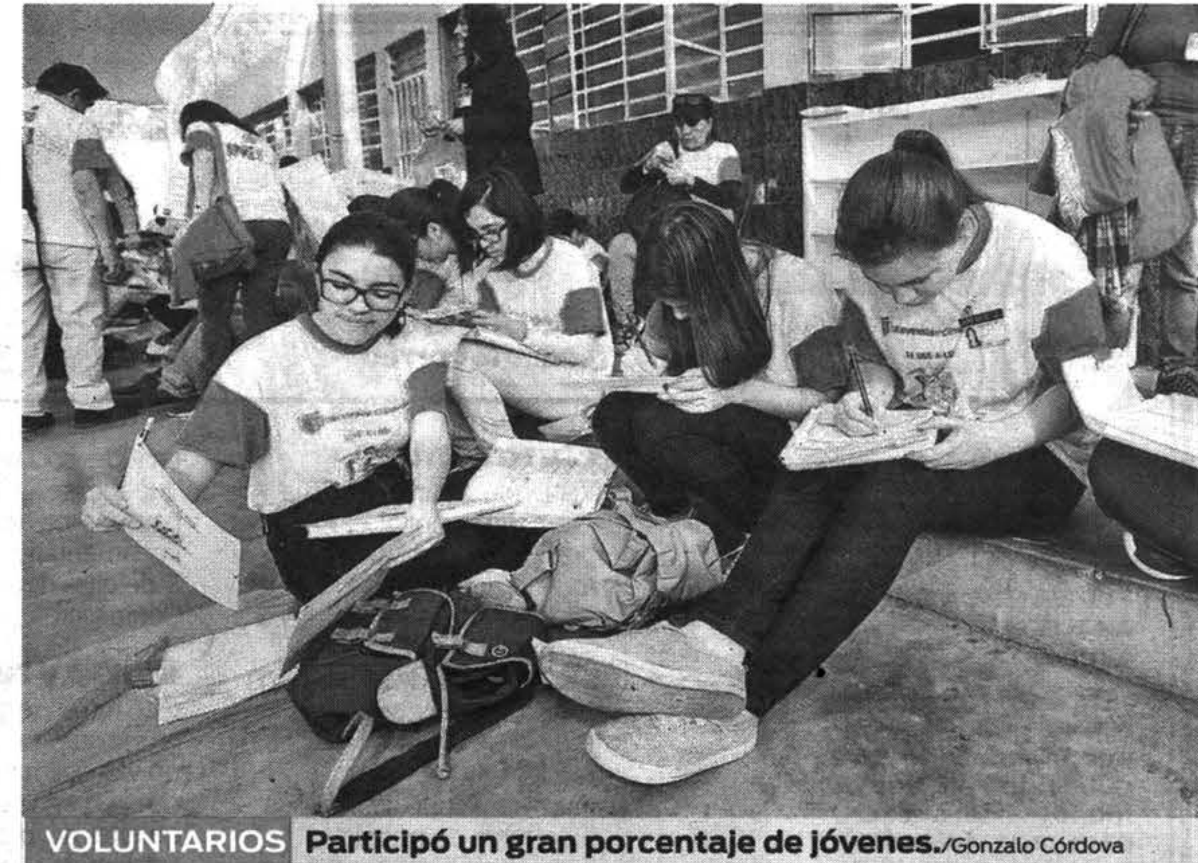
VOLUNTARIOS Participó un gran porcentaje de jóvenes.