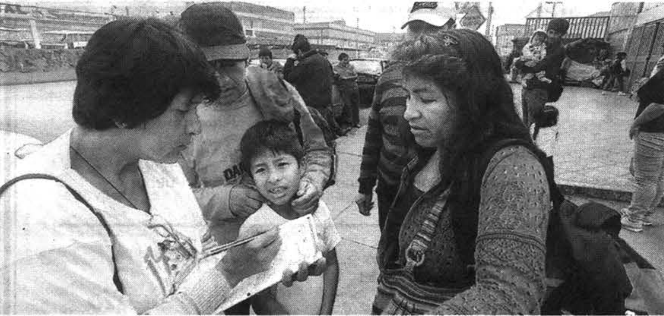
En general, la jornada transcurrió con normalidad, salvo algunos incidentes.

9 millones de viviendas fueron empadronadas durante el Censo Nacional.