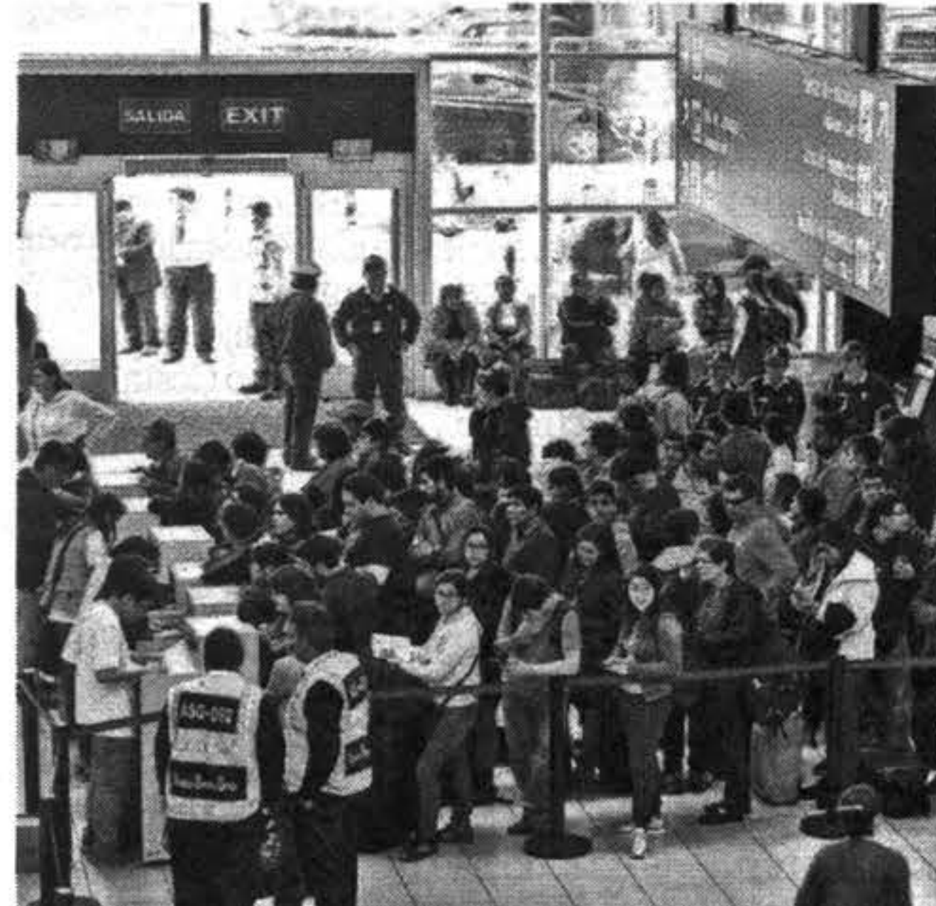
En el aeropuerto reinó la confusión.

RECHAZO. Los cuestionamientos primeros vienen de líderes parlamentarios. Jorge del Castillo, del APRA, escribió en Twitter: "Es inaceptable, el convenio dice que hay que dar a la Universidad (César Vallejo) los datos definitivos del censo (...). El jefe del INEI tiene que ir a la Comisión de Fiscalización de inmediato. Es un escándalo". El censo asegura que los resultados del empadronamiento son "confidenciales". Ahora, resulta que en la UCV, vinculada a un partido político (APP), acotó. En otro momento, dijo esperar el pronunciamiento de la premier Mercedes Aráoz,