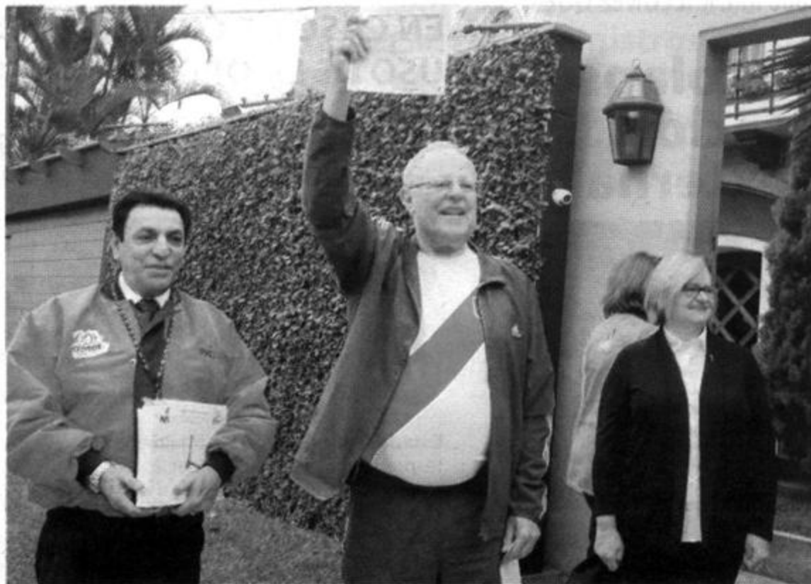
■ El presidente Kuczynski, acompañado de su esposa Nancy Lange y del jefe del INEI.

De igual modo, la ministra de Desarrollo e Inclusión Social, Fiorella Molinelli, llegó hasta Carapongo, Chosica y Lurigancho, Lima; la ministra Agricultura y Riego,