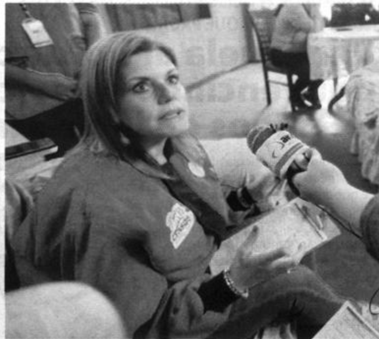
■ Premier cumplió como empadronadora en Punta Hermosa

orien en una disputa limítrofe de hace 31 años con Calca por los límites del distrito de Quellouno.