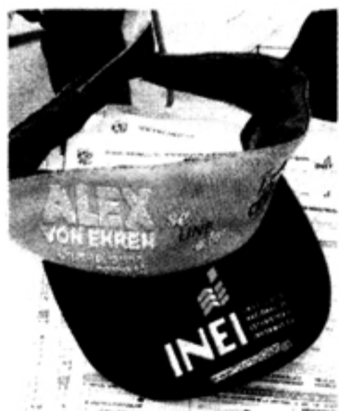
Gorra donada por candidato.