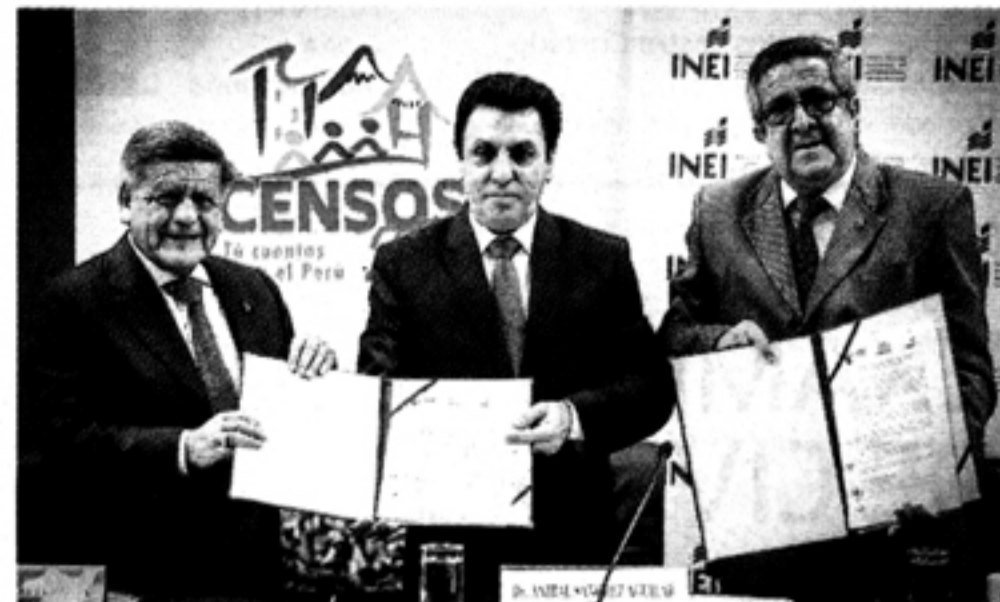
DUDAS. INEI firmó convenios con UCV y otras universidades.