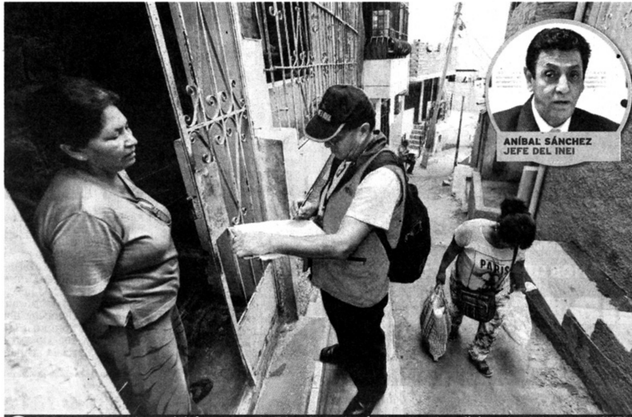
👁 Cada empadronador recibirá un pago de 50 soles, además de otros beneficios otorgados por el INEI.

👁 Ojo, ALGO+ Para la actividad del domingo, el INEI dividió el país en 10 mil zonas censales, con 100 mil jefes de sección. Cada uno de ellos dirige a seis empadronadores.