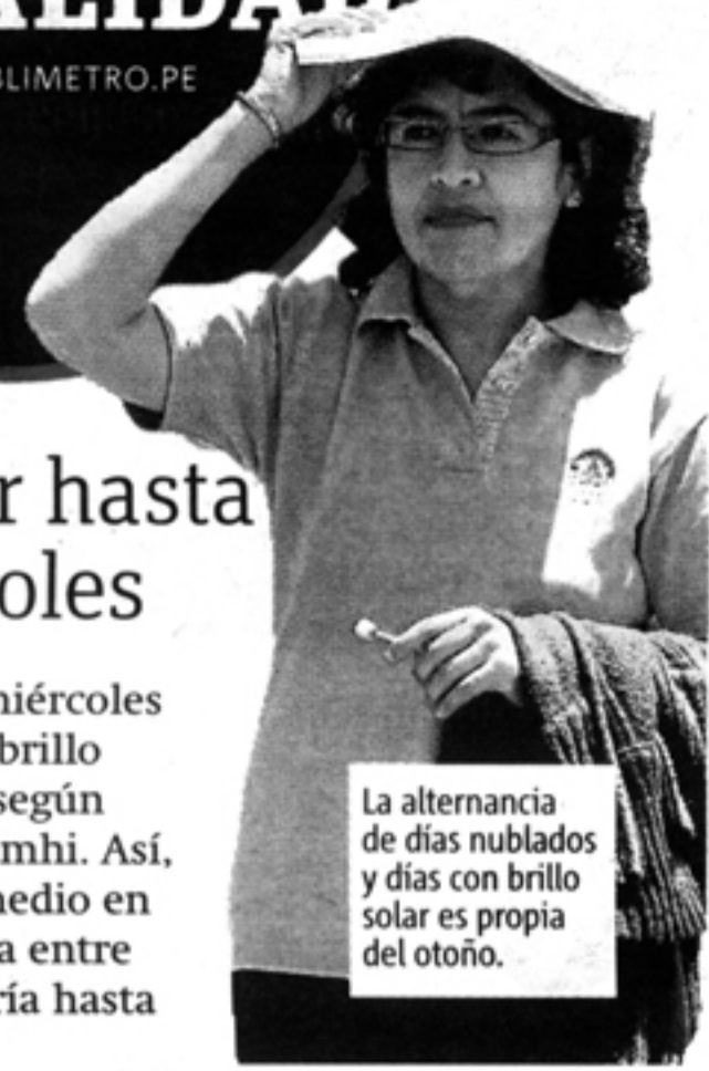
La alternancia de días nublados y días con brillo solar es propia del otoño.