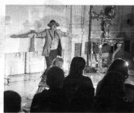
El ingreso a todas las funciones es libre. Capacidad limitada. MML

Este mes, la Municipalidad de Lima presentará los Martes Escénicos (13, 20 y 27 de junio), con diferentes obras en el Salón Dorado del Teatro Municipal (Jr. Ica 377, Lima) a las 7 p.m. Mañana se verá ¿Y tú lo harías? de Carmen Armas.