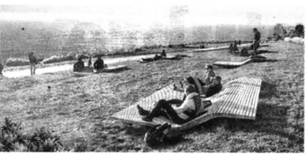
El terreno está en una plataforma alta del acantilado de San Isidro.