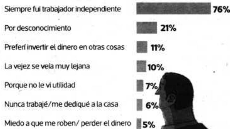
Encuesta a no pensionistas de 70 años a más ¿Por qué no aportó a un fondo de pensiones?