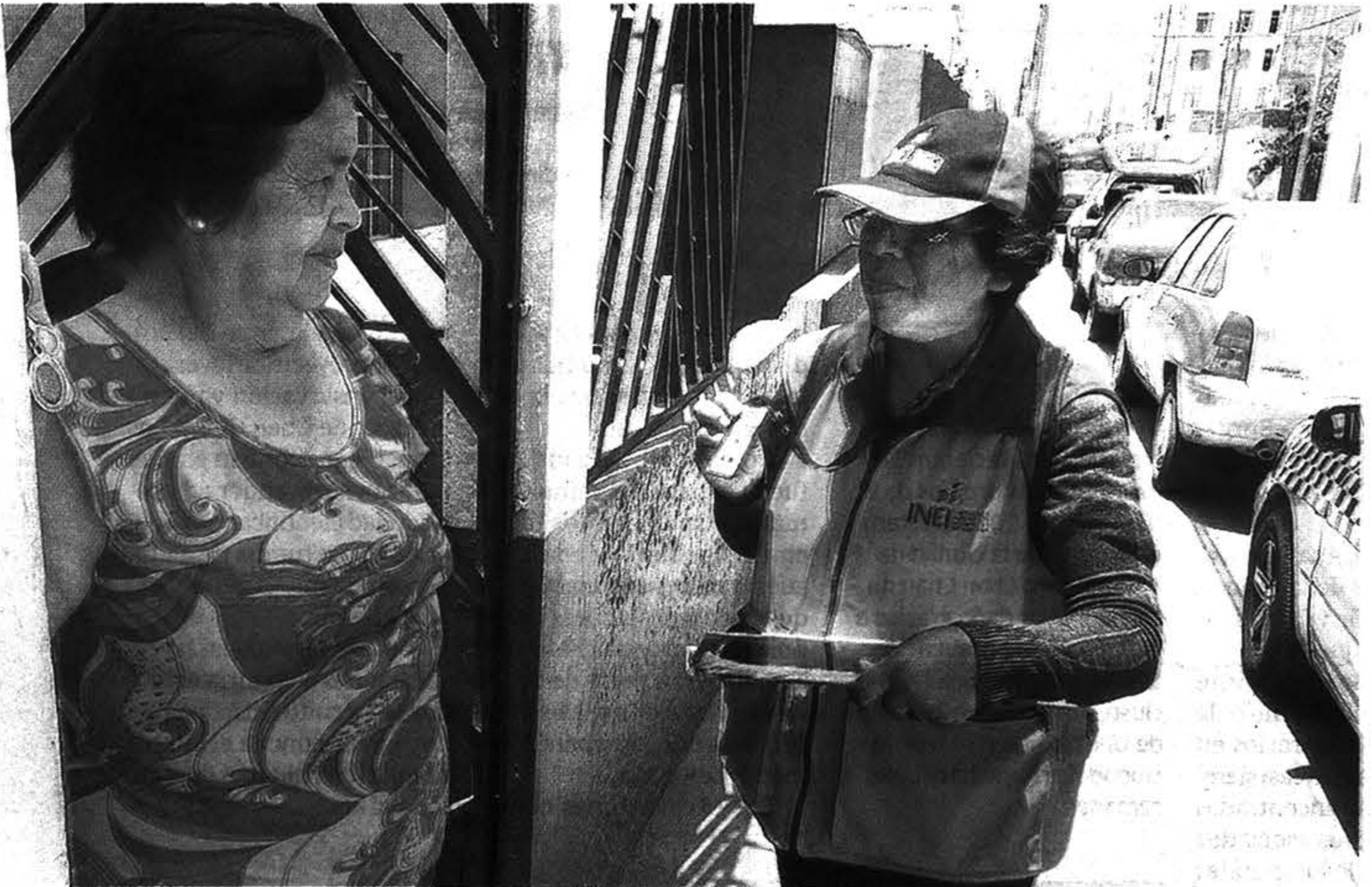
ENCUESTADOR. Empadronadores recorrerán zonas cercanas a su lugar de residencia. Visitarán las casas a partir de las 8 a.m.