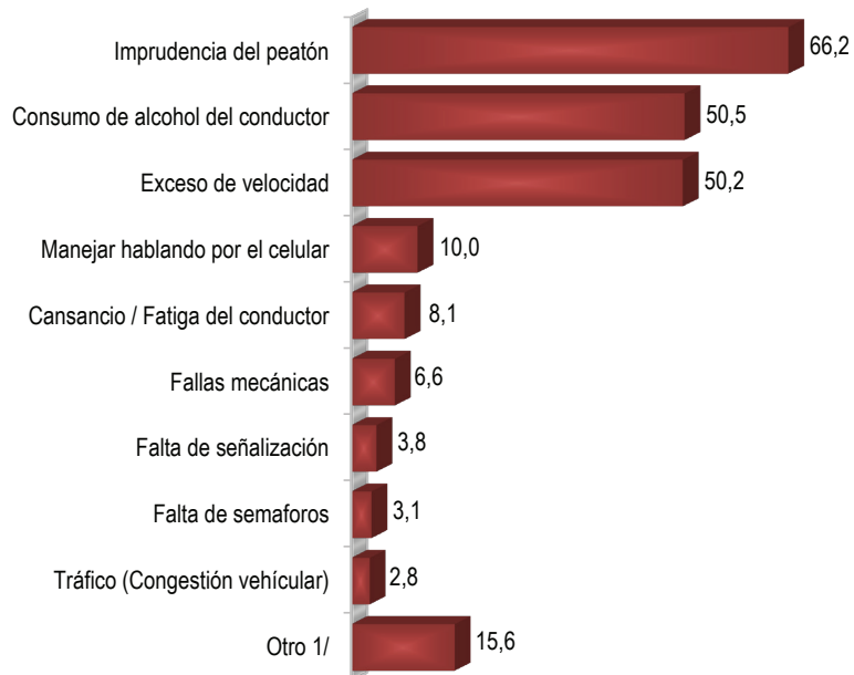
Perú Urbano: Percepción de la población sobre las causas más frecuentes que generan los accidentes de tránsito, 2015 (Porcentaje)

Nota: La sumatoria no da el 100% por ser de respuestas múltiples.